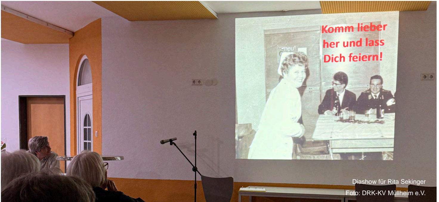
Diashow für Rita Sekinger